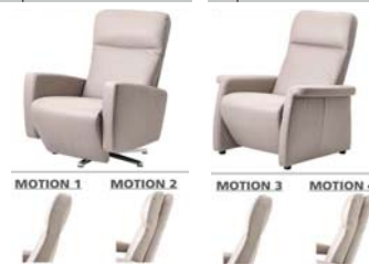
Beispiel Motion 1 und Motion 2 Beispiel Motion 3 und Motion 4