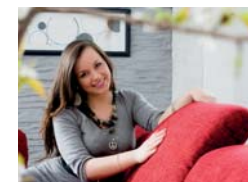
Kopfteilverstellung (optional, Mehrpreis)