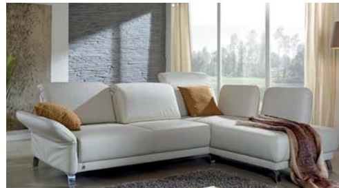
Dieses Modell bekommen Sie in verschiedenen Größen und Farbvarianten

Zeitlos in der Optik - viel Raffinesse im Detail!