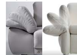
AT1 2 Armteile zur Auswahl AT2 Armteil klappbar (optional, Mehrpreis)