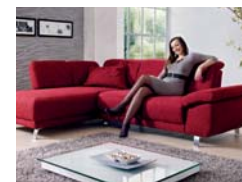
2 Sitzhöhen - preisgleich