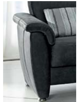
Armlehne D ca. 20 cm