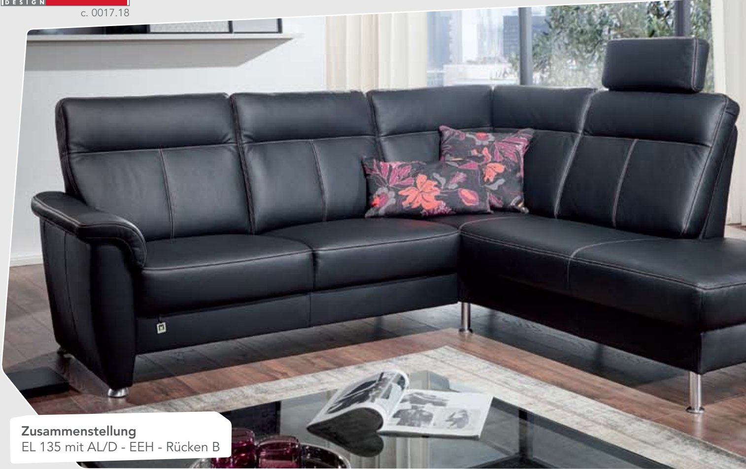
Zusammenstellung EL 135 mit AL/D - EEH - Rücken B