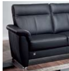
Ausführung B, mit senkrechter Mittelnaht - generell bei Leder, wahlweise auch bei Stoffbezug möglich