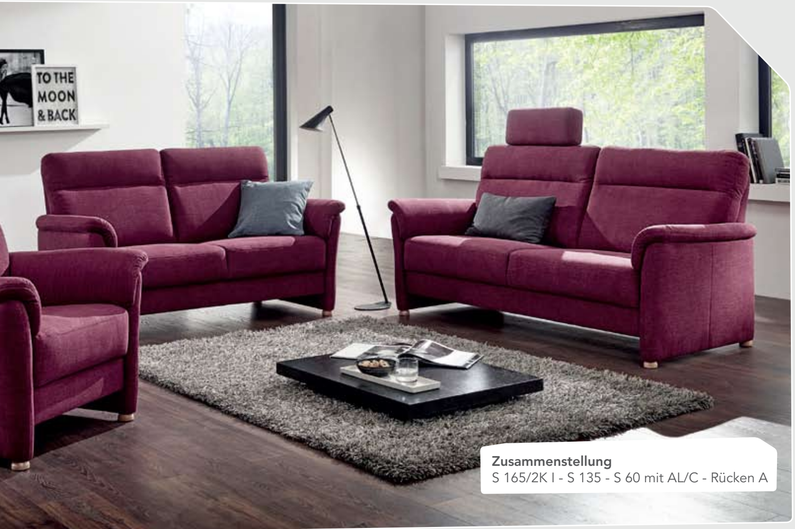
Zusammenstellung S 165/2K I - S 135 - S 60 mit AL/C - Rücken A