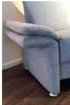
Armlehne B (klappbar) ca. 18 - 28 cm Mehrpreis - s. Preisliste