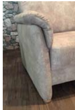
Armlehne C ca. 15 cm