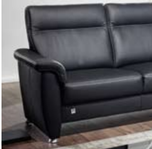
Ausführung A, glatt - nur in Stoff lieferbar