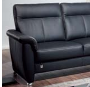
Ausführung B, mit senkrechter Mittelnaht - generell bei Leder, wahlweise auch bei Stoffbezug möglich