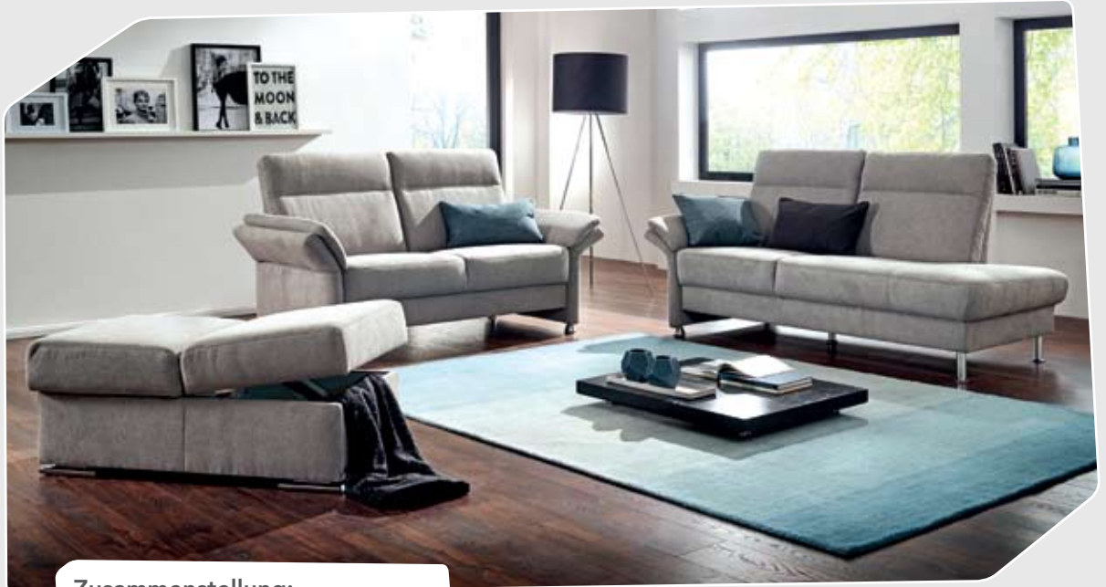
Zusammenstellung: S135 - REC mit AL/B - Rücken A