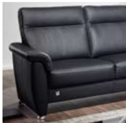
Ausführung A, glatt - nur in Stoff lieferbar