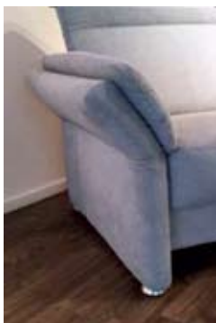
Armlehne A ca. 23 cm