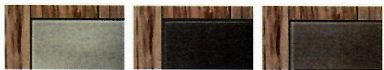
HG | grauweiß

* eingeschränkt verfügbar siehe Typenliste (Webseite)